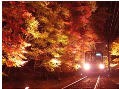
紅葉のキレイな沿線

叡山電鉄は名前の通り、「比叡山」と「鞍馬寺」参詣を目的として開業した、京都洛北の一私鉄ですが、鉄チャン的には、50% (ハ-ミル) の急勾配を登坂する力強い車両の開発、同時に下り坂での電気ブレーキの採用、乗り心地改善のための直角カルダンの採用などを、山間地を走るために急カーブに対応した短い15m車両にギッシリと詰め込む努力を孤軍奮闘している話題性のある頼もしい会社です。