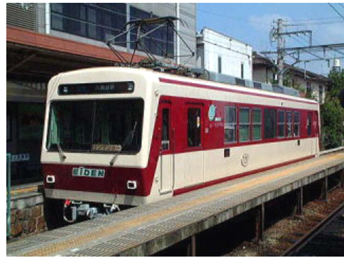
単車両運行になったときの車両